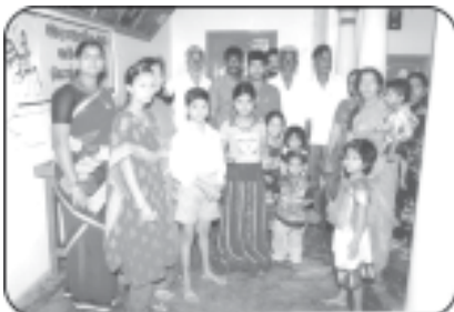
பண்குட்டி நகர மக்கள் ஹோலிப் பண்டிகை கொண்டாடி மகிழும் காட்சி