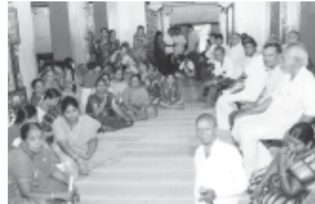
17.4.2011 அன்று திருச்சி கிளை சார்பாக சத்திய நாராயண சுவாமி பூஜையில் கலந்து கொண்ட நமது சமூகத்தவர்